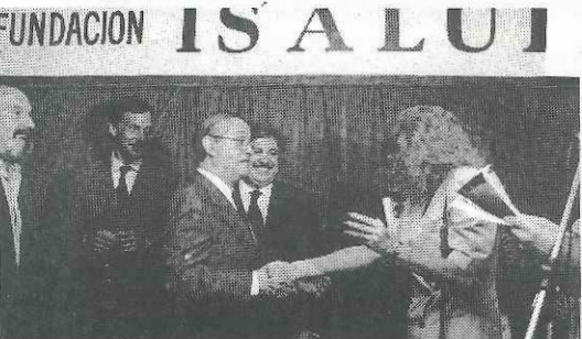
Hospital Fernández (C. Federal)

Por su respuesta a los accidentes y las emergencias en general, se ha simbolizado la extraordinaria labor de los hospitales públicos de todo el país en un tipo de patologías en donde es fundamental la necesidad de una respuesta inmediata y efectiva. En tiempos en que lo público está cuestionado por algunos sectores, la población en general, sin distinción de clases ha concurrido masivamente a estos dos importantes centros de salud, por epidemias, accidentes de tránsito, cólera, SIDA o intoxicaciones como por los medicamentos.