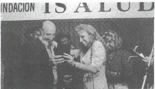
Hospital Eva Perón (San Martín)

Por su respuesta a los accidentes y las emergencias en general, se ha simbolizado la extraordinaria labor de los hospitales públicos de todo el país en un tipo de patologías en donde es fundamental la necesidad de una respuesta inmediata y efectiva. En tiempos en que lo público está cuestionado por algunos sectores, la población en general, sin distinción de clases ha concurrido masivamente a estos dos importantes centros de salud, por epidemias, accidentes de tránsito, cólera, SIDA o intoxicaciones como por los medicamentos.