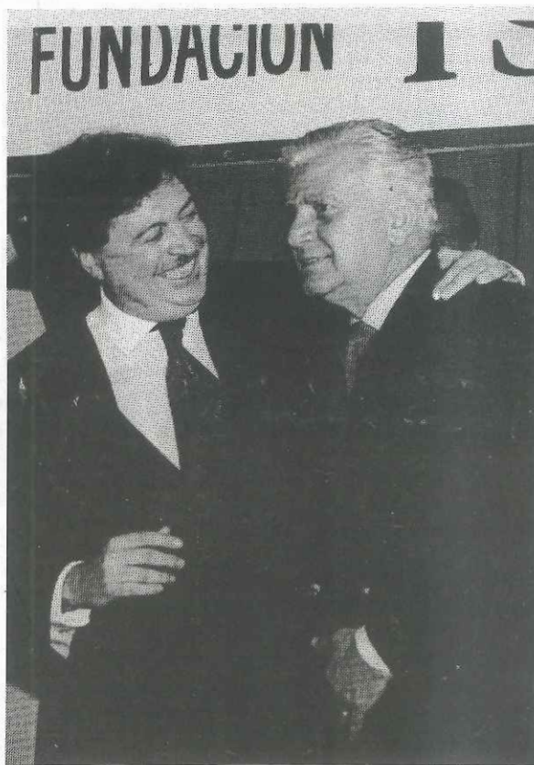
Con la presencia del Senador Nacional Dr. Antonio Cafiero se cumplió la ceremonia de entrega de los PREMIOS ISALUD 1992. La foto ilustra el momento que el Dr. Ginés González García lo invita a dirigir la palabra a la concurrencia.

Los tiempos han cambiado pero los ideales y objetivos vinculados con la justicia social no se modifican. Por eso nuestro compromiso de hacer con todos y para todos, más y mejores acciones el año próximo. □