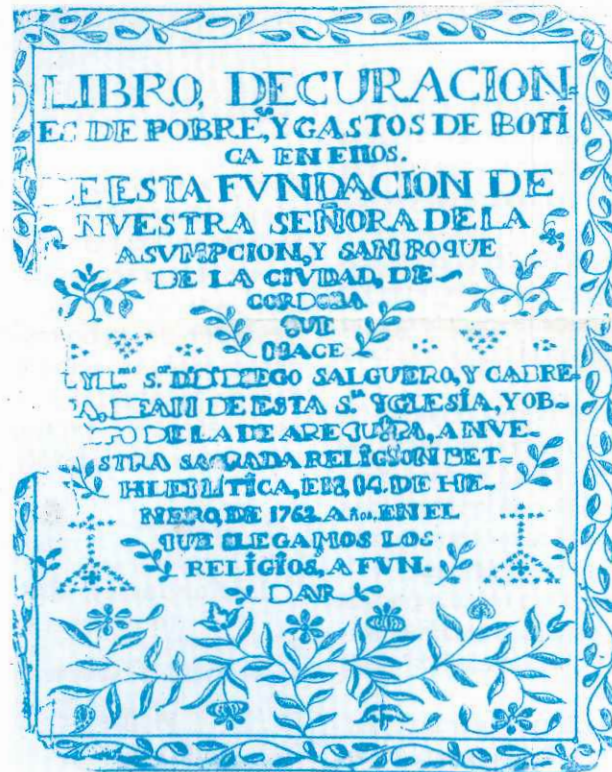
Carátula del "Libro de curaciones de pobres y gastos de botica en ellos". Hospital de San Roque, Córdoba 1762

un verdadero cambio en el profesional que involucre la resocialización de los conductores. Tan importantes como los docentes son los colegas de curso. Tan importantes como los contenidos son los métodos y técnicas pedagógicas. Tan importante como la docencia es la investigación aplicada que produzca y ponga a prueba los conocimientos. Desde su nacimiento ISALUD está comprometida con la reforma sectorial, como una fundación nacional que conoce y reconoce los grandes esfuerzos que se están realizando en el proceso educativo a los recursos humanos de la salud. Entendemos que