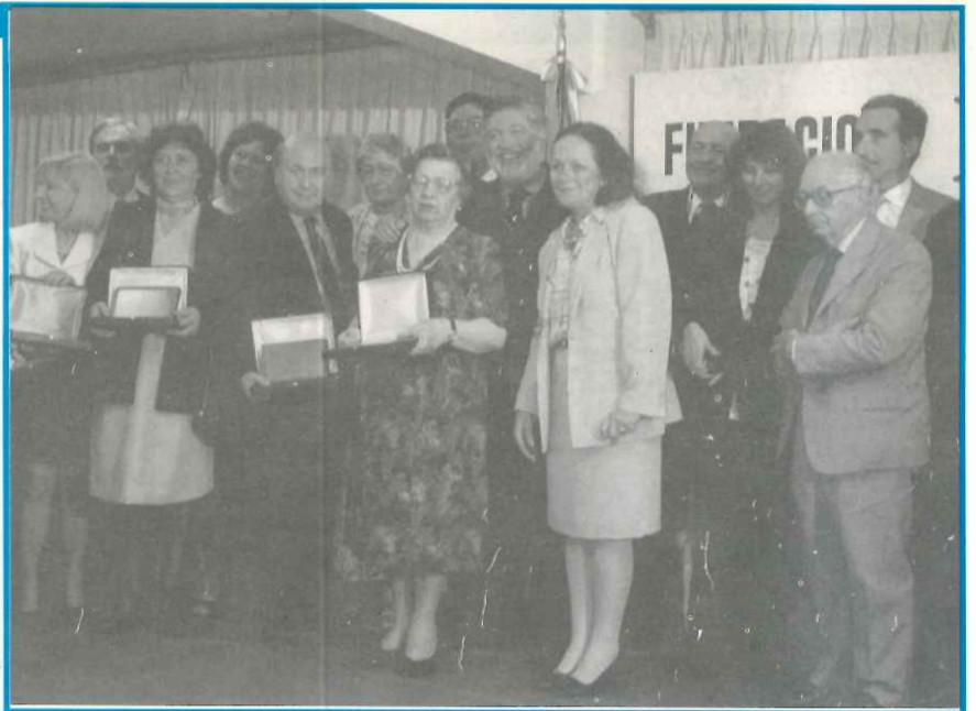
Emotivo momento de todos los homenajeados junto a nuestro Director Dr. Ginés González García.