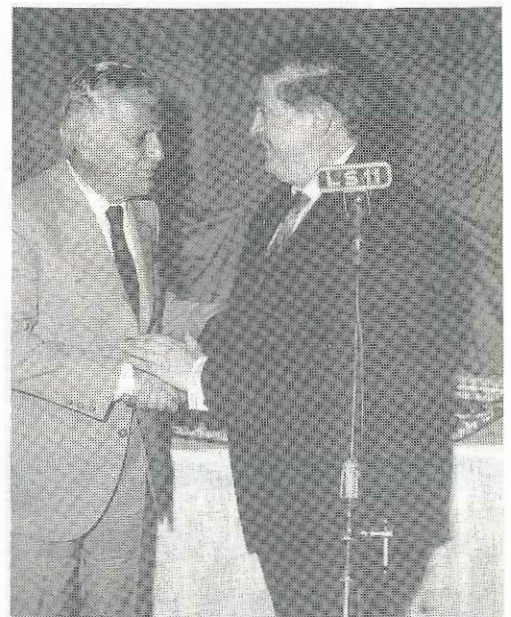
Una vez finalizadas las palabras de agradecimiento, por parte del Dr. Ginés González García, recibe las felicitaciones del Dr. Antonio Francisco Cafiero.