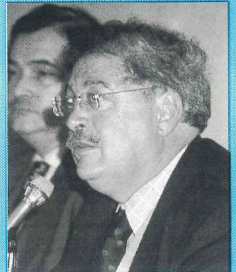
El Dr. Ginés González García pronuncia las palabras de apertura del Segundo Encuentro Nacional de Hospitales.

El presente y el futuro de las realizaciones de perfeccionamiento es promisorio, por la respuesta que se ha obtenido. Todo lo que se proyecte será para acompañar o adelantarse —con profesionales más capacitados— a los cambios producidos en el sector salud y a los que aún deben producirse. □