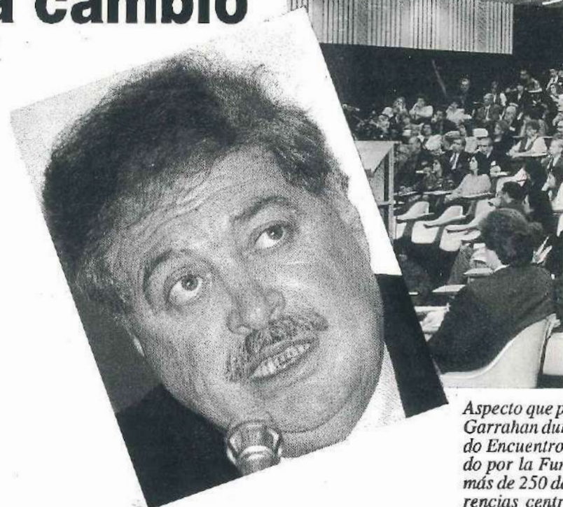
Aspecto que p Garrahan du do Encuentro do por la Fun más de 250 de rencias centr doctores Rafa

Agregó a todo lo precedentemente expuesto, los conceptos de más participación, descentralización y aplicación al máximo de los conocimientos científicos. Con respecto a esto último dijo que era