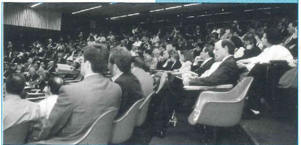
Vista parcial del auditorio del Hospital Garrahan durante una de las sesiones plenarias.