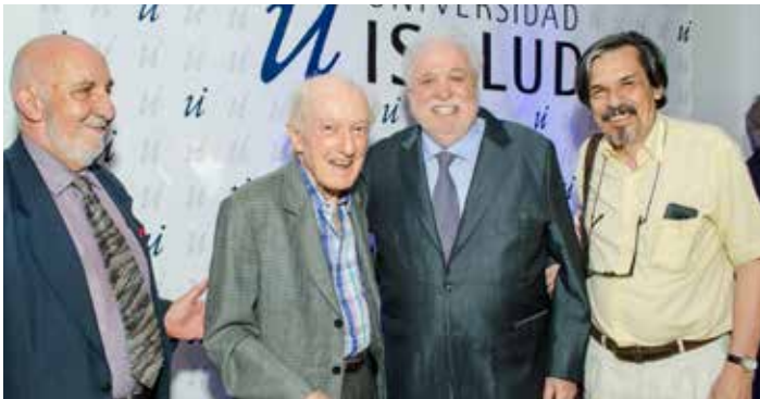
El ex ministro de Salud de la Nación Aldo Neri junto a Ginés González García