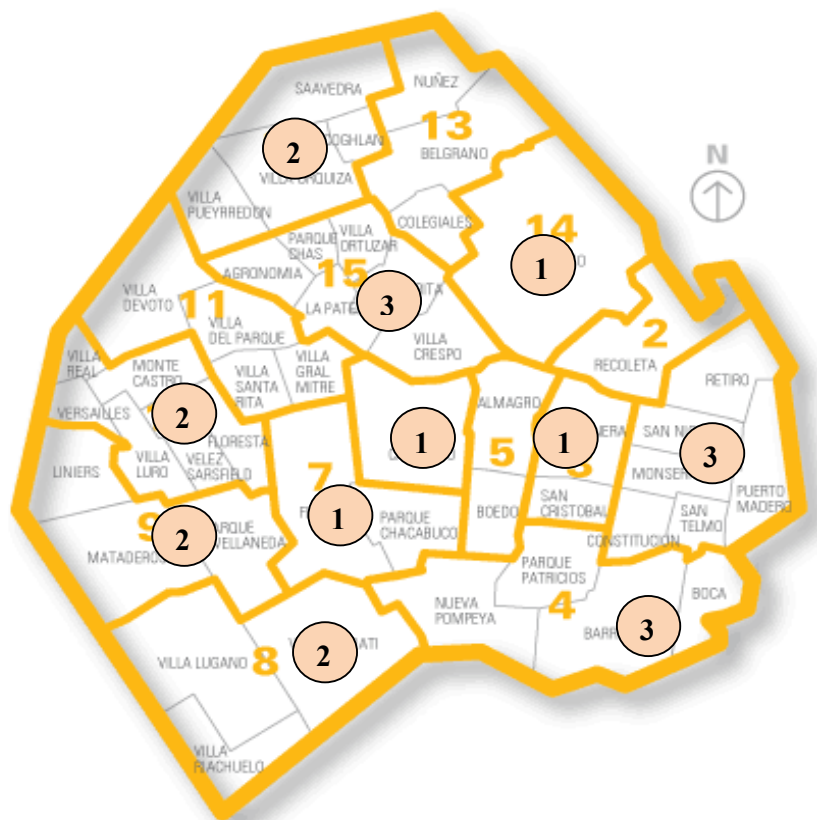
Gráfico N° 3 Distribución de los Centros de Día por Comuna

Los 21 Centros de Día se distribuyen en la Ciudad de Buenos Aires de acuerdo al siguiente mapa: