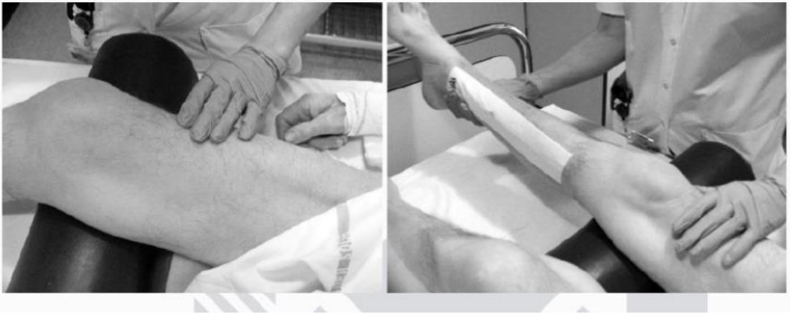
Imagen obtenida: Yang, JL, Chang, CW, Chen, SY, Wang, SF y Lin, JJ, 2007, “Técnicas de movilización en sujetos con síndrome de hombro congelado: ensayo aleatorizado de tratamiento múltiple”, Fisioterapia.