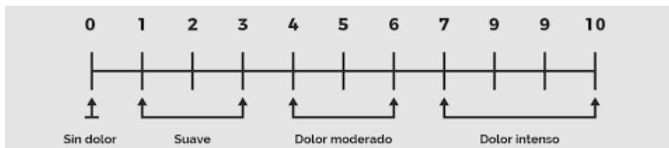
Figura 3 - Escala Visual Analógica (EVA), (Keele, 1948);