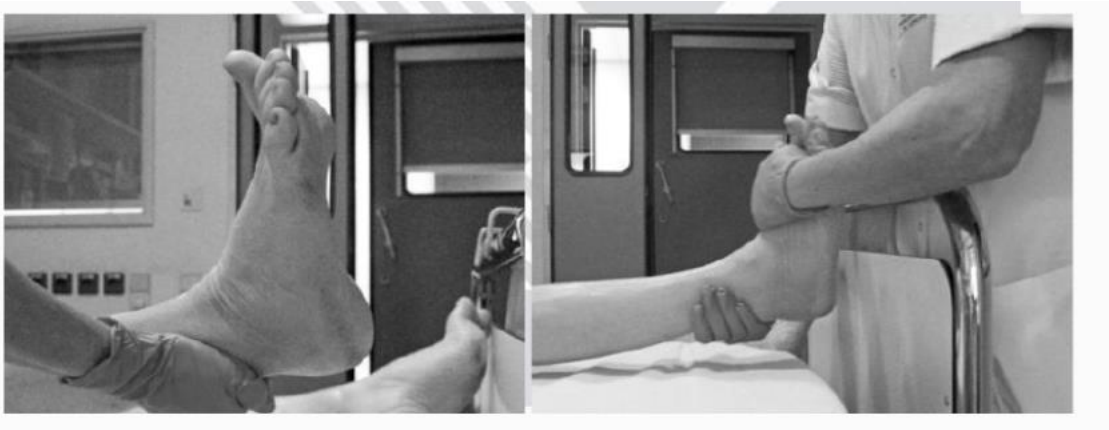
Imagen obtenida: Yang, JL, Chang, CW, Chen, SY, Wang, SF y Lin, JJ, 2007, “Técnicas de movilización en sujetos con síndrome de hombro congelado: ensayo aleatorizado de tratamiento múltiple”, Fisioterapia.