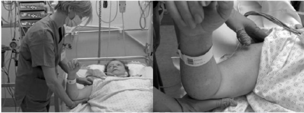
Imagen obtenida: Yang, JL, Chang, CW, Chen, SY, Wang, SF y Lin, JJ, 2007, “Técnicas de movilización en sujetos con síndrome de hombro congelado: ensayo aleatorizado de tratamiento múltiple”, Fisioterapia.