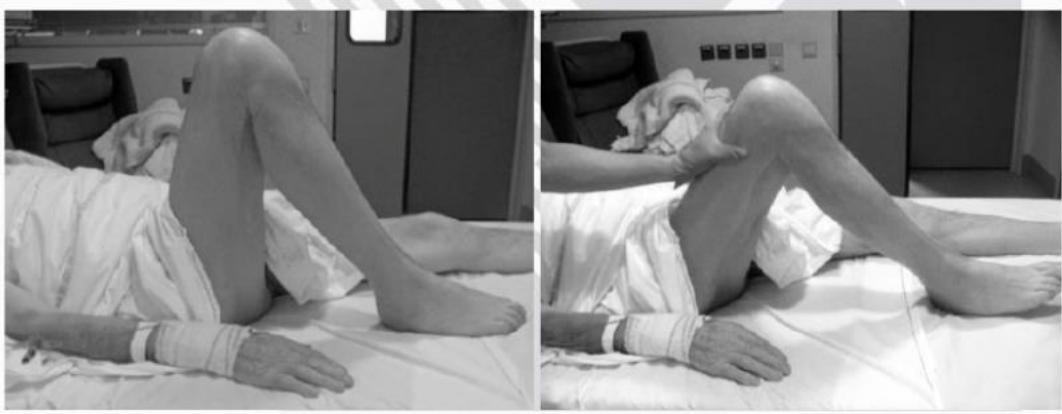
Imagen obtenida: Yang, JL, Chang, CW, Chen, SY, Wang, SF y Lin, JJ, 2007, “Técnicas de movilización en sujetos con síndrome de hombro congelado: ensayo aleatorizado de tratamiento múltiple”, Fisioterapia.